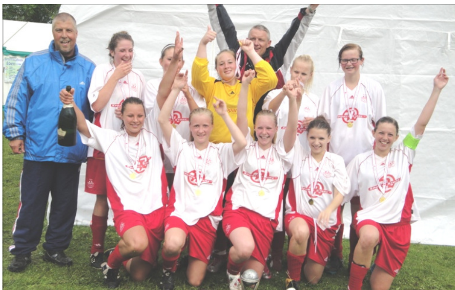
SM-guld til U18-pigerne (række 1).

Medlemsblad for Gymnastik og Idrætsforeningen ORIENT