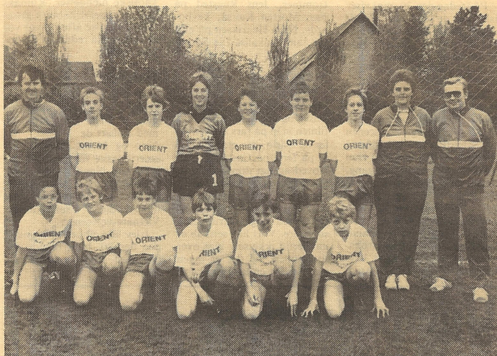
Dette billede er historisk. Det forestiller det første Orient-hold som optræder med reklamer på spilletøjet. Sponsoren er Islev Vin&Tobak.