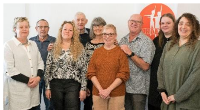
Orients bestyrelse februar 2023